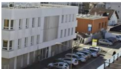
Pro'Pulse, logée actuellement dans 80 m 2 au 11 rue Ader (bâtiment blanc), déménage quelques mètres plus loin, dans 225 m 2 anciennement occupés par la Brocante de mamie (bâtiment ocre).

prévue. « C'est en cours d'étude par un groupe d'étudiants de l'IAE [Institut d'administration des entreprises, NDLR] de Grenoble », renseigne Mme Herandez. Un atelier de couture devrait également voir le jour. « Il est en attente depuis plusieurs mois et nous espérons développer ce projet en partenariat avec Les Ateliers Marianne », un chantier d'insertion apportant une réponse innovante à l'insertion des publics précaires.